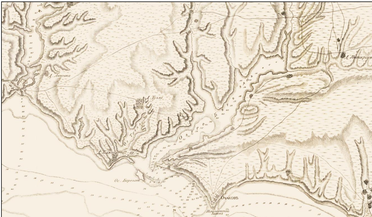
Рис. 3. Шляхи до Очакова у 1791 р. [32, ф-т].