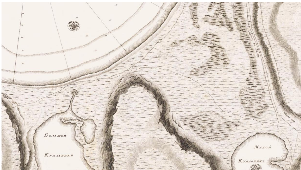
Рис. 1. Район Куяльницько-Хаджибейського пересипу (близько 1795 р.) [34].