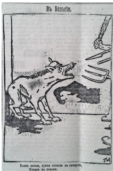
Рис. 6. В Бельгии. “Вовк у ночі, думаючи попасти у вівчарню, попав у псарню” (Последние новости. 7 августа 1914 г. № 2516)

Досить часто зооморфні алегорії використовувалися карикатуристами для позначення ворожих Росії держав. В основному їхній зміст спрямовувався на висвітлення негативних аспектів ворога та демонстрування його хиткої позиції у війні. Так, на одній із карикатур Німеччина була представлена в образі орла, становище якого у ході війни змінюється: від сильного та здорового до покаліченого та перебинтованого (рис. 5) [9, с. 1]. В іншій ілюстрації для позначення німецької сторони використано алегорію вовка, якого супротивники за допомогою вил, кийка та штика загнали у безвихідне становище: “Вовк у ночі, думаючи попасти у вівчарню, попав у псарню” (рис. 6) [10, с. 4]. Подібні сюжети переконували читача в тому, що становище ворога є складним і незабаром, через значний опір підкорених народів та натиск країн-членів Антанти, Німеччина та її союзники зазнають поразки.