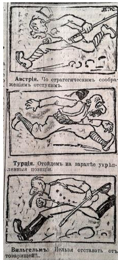
Рис. 12. Австрія. По стратегическимъ соображеніямъ отступимъ. Турція. Отойдёмъ на заранѣ укрѣпленныя позиціи. Вильгельмъ: Нельзя отставать отъ товарищей! (Южная копейка. – 1916. – 10 августа. – № 2049)

Період кінця 1916 початку 1917 рр. відзначився появою у ЗМІ значної кількості матеріалів, що відображали складне внутрішньополітичне та військове становище ворога. Автори публікацій та зображень наголошували, що Німеччина та її союзники відчують значний дефіцит продовольчих запасів, фуражу, озброєння та інших необхідних речей для ведення військових дій. Яскравим прикладом подібного пропагандистського матеріалу є карикатура “Кінна” атака”, в якій відображено та висміяно факт відсутності достатньої кількості коней для австро-німецької кавалерії (рис. 13) [17, с. 2].