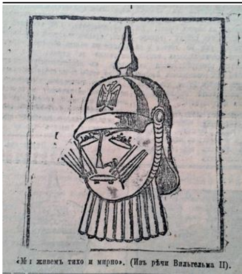
Рис. 1. Мы живем тихо и мирно (Последние новости. 30 июля 1914 г. № 2499)

ІІ характерних рис Наполеона Бонапарта та пророкували німецькому кайзеру таку ж саму долю, якої колись зазнав французький імператор – поразку та заслання (рис. 3) [7, с. 2].