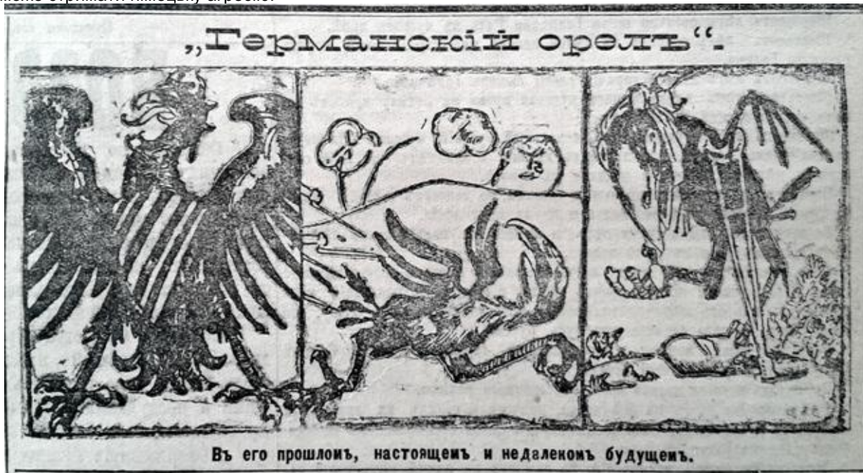
Рис. 5. “Германский орел” (Последние новости. 7 августа 1914 г. № 2516)

ходять ведмеді і, що вона є носієм грубої сили [1, с. 85]. Фактично, образ ведмедя для всіх західноєвропейських держав був універсальним “замінником” Росії, який позначав її дикість, ненаситність, рабський характер, відсталість тощо [2, с. 103–104]. Проте, в самій Російській імперії така зооморфна алегорія була трансформована у позитивно-закономірне явище. Образ ведмедя набув ідеологічно-символічного значення й трактувався як прояв сили, міцності та незламності і, що під час війни тільки він може стримати німецьку агресію.