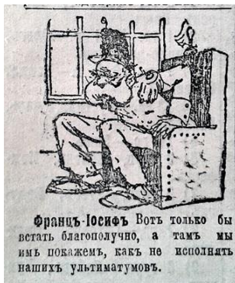
Рис. 2. Франц-Йосиф (Последние новости. 2 августа 1914 г. № 2506)

Початок світового конфлікту в Російській імперії ознаменувався широкою пропагандою міфу про “другу вітчизняну війну”. ЗМІ активно проводили порівняння та алегорії між подіями 1914 та 1812 рр. Карикатуристи надавали Вільгельму