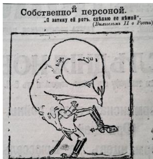
Рис. 4. Собственной персоной (Последние новости. 30 июля 1914 г. № 2499)

Для підсилення ефекту сприйняття побаченого та надання зображенню символічного контексту авторами сатиричної графіки застосувався прийом зооморфної алегорії, тобто уподібнення до тварин. Карикатура “Собственной