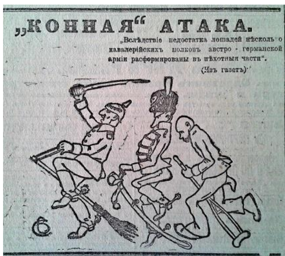
Рис. 13. “Конная” атака (Южная копейка. 4 сентября 1916 г. № 2074)

Період кінця 1916 початку 1917 рр. відзначився появою у ЗМІ значної кількості матеріалів, що відображали складне внутрішньополітичне та військове становище ворога. Автори публікацій та зображень наголошували, що Німеччина та її союзники відчують значний дефіцит продовольчих запасів, фуражу, озброєння та інших необхідних речей для ведення військових дій. Яскравим прикладом подібного пропагандистського матеріалу є карикатура “Кінна” атака”, в якій відображено та висміяно факт відсутності достатньої кількості коней для австро-німецької кавалерії (рис. 13) [17, с. 2].