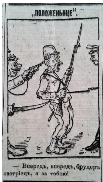
Рис. 8. Положеньце (Южная копейка. 1916. 3 июля. № 1916)

Разом з тим, окремі карикатури були присвячені ставленню німецького імператора до лідерів інших країн Четверного союзу. Зокрема, в одній із них турецького султана зображено у вигляді маріонетки, якою вдало маніпулює Вільгельм II (рис. 9) [13, с. 4]. Інша карикатура відображала характер відносин між Німеччиною та Болгарією: німецький кайзер штовхає болгарського царя і наказує йому беззаперечно коритися (рис. 10) [14, с. 3]. У суспільній думці утверджувалась ідея про нерівноправність союзницьких відносин між країнами Четверного союзу і, що для Німеччини Туреччина та Болгарія виступали лише джерелом матеріальних і людських ресурсів у війні за світове панування.