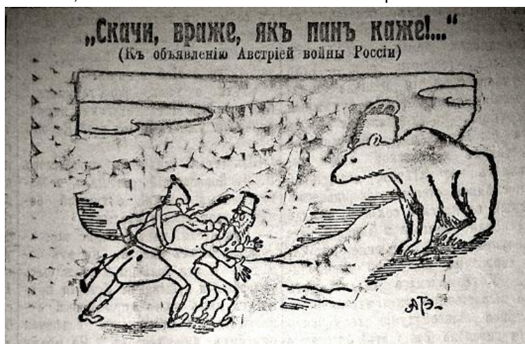
Рис. 7. Скачи, враже, як пан каже (Последние новости. 1914. 3 августа. № 2508)

Значна частина тогочасної сатиричної графіки була присвячена дискредитації та висміюванню відносин між німцями та їхніми союзниками. У карикатурі “Скачи враже, як