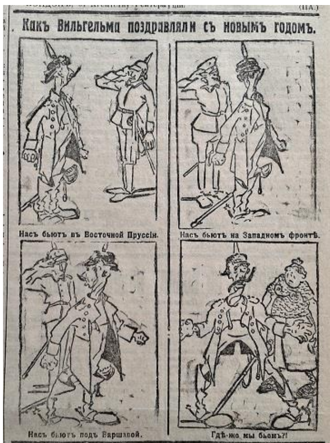
Рис. 11. Какъ Вильгельма поздравляли съ новымъ годомъ (Южная копейка. 1915. 5 января. № 1424)