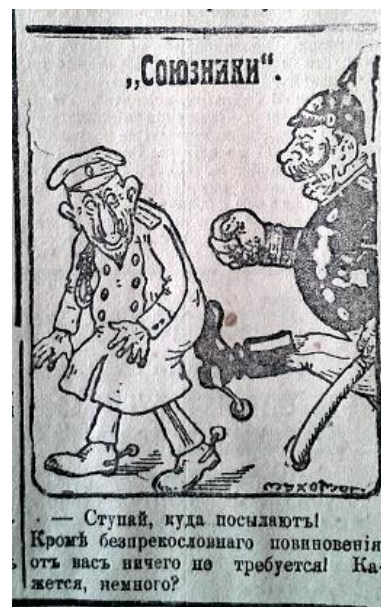
Рис. 10. Союзники (Южная копейка. 1916. 24 января. № 1853)

Одним із тематичних напрямків карикатур було демонстрування факту постійних військових невдач ворога. Наприклад, в газеті “Южная копейка” була розміщена ілюстрація “Як Вільгельма привітали з новим роком” на якій відображено донесення німецького офіцера імператору про поразки на різних ділянках Західного та Східного фронтів і реакція кайзера на такі факти: “Нас б'ють у Східній Пруссії. Нас б'ють на Західному фронті. Нас б'ють під Варшавою. А де ж ми б'ємо?!” (рис. 11) [15, с. 3].