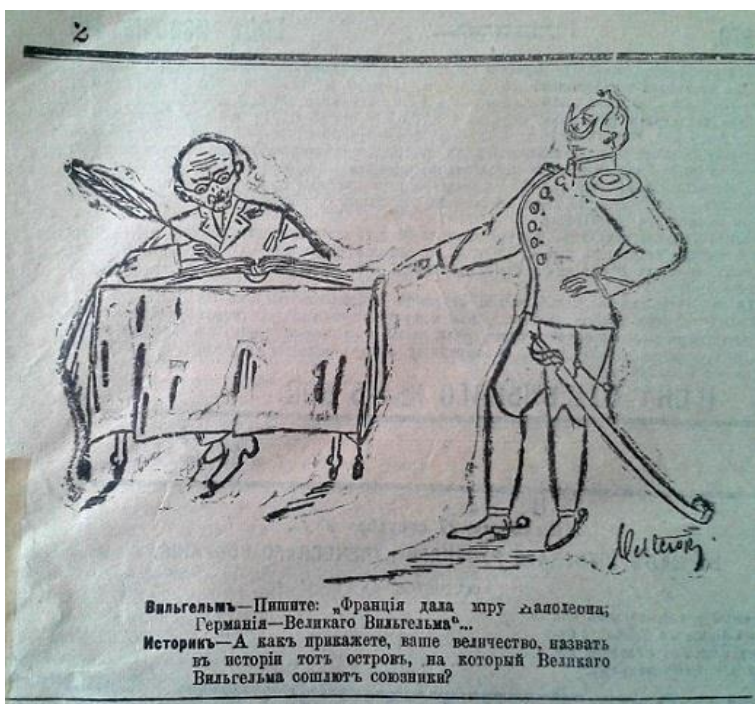
Рис. 3. Вильгельм – Пишите: “Франция дала миру Наполеона; Германия – Великому Вильгельму”... Историк – А как прикажете, ваше величество, назвать в истории тот остров на которой Великого Вильгельма сошлют союзники?” (Киев. 24 сентября 1914 г. № 254)

ІІ характерних рис Наполеона Бонапарта та пророкували німецькому кайзеру таку ж саму долю, якої колись зазнав французький імператор – поразку та заслання (рис. 3) [7, с. 2].