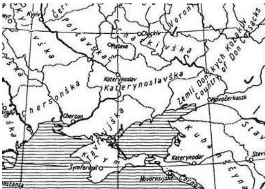
Карта "Адміністративно-територіальний поділ Півдня України на 1914 р." 2

Копіювання губерньського дореволюційного устрою німцями призвело до ліквідації радянського поділу Півдня України на Дніпропетровську, Миколаївську, Запорізьку області. При цьому німецька окупаційна адміністрація незмінним залишила довоєнний поділ на райони, адже "...це влаштовувало окупантів з адміністративної і господарської точки зору, а також тому що населення звикло до них" [4, с.94]. Загалом же "подальший адміністративний поділ не відповідав доокупаційному: з одного боку, з політичних міркувань, з іншого – внаслідок незбігу територій німецьких військових органів з територіями колишніх областей (польові комендатури контролювали по кілька колишніх районів, які після передачі управління цивільній адміністрації рейхскомісаріату становили основу крайзгебітів)" [11, с.60].