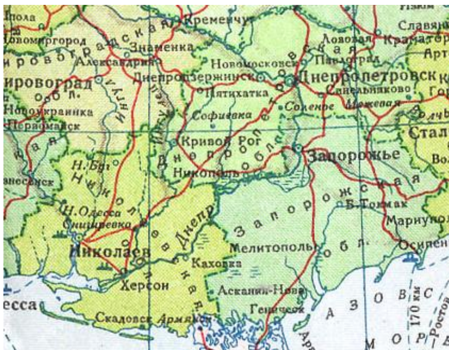
Карта “Адміністративно-територіальний поділ Півдня України у складі УРСР станом на 1940 р.” 1

Територія Запорізької області була поділена між генеральними округами “Дніпропетровськ” та “Крим” (“Таврія”). До складу генерального округу “Дніпропетровськ” були передані такі довоєнні запорізькі райони, як Запорізький сільський, Червоноармійський, Новомиколаївський, Оріхівський, Гуляйпільський, Новозлатопільський, Пологівський, Куйбишевський, Чернігівський, Кам’янсько-Дніпровський, Великобілозерський, Великолепетиський, Великотокмацький, Василівський, Михайлівський, Бердянський, Ногайський, Андріївський [12, с.138]. В межах генерального округу “Таврія” (“Крим”) опинилися наступні запорізькі райони: Мелітопольський, Приазовський, Нововасилівський, Якимівський, Нижньосірогозький, Іванівський, Веселівський, Генічеський, Сиваський і Новотроїцький [12, с.138].