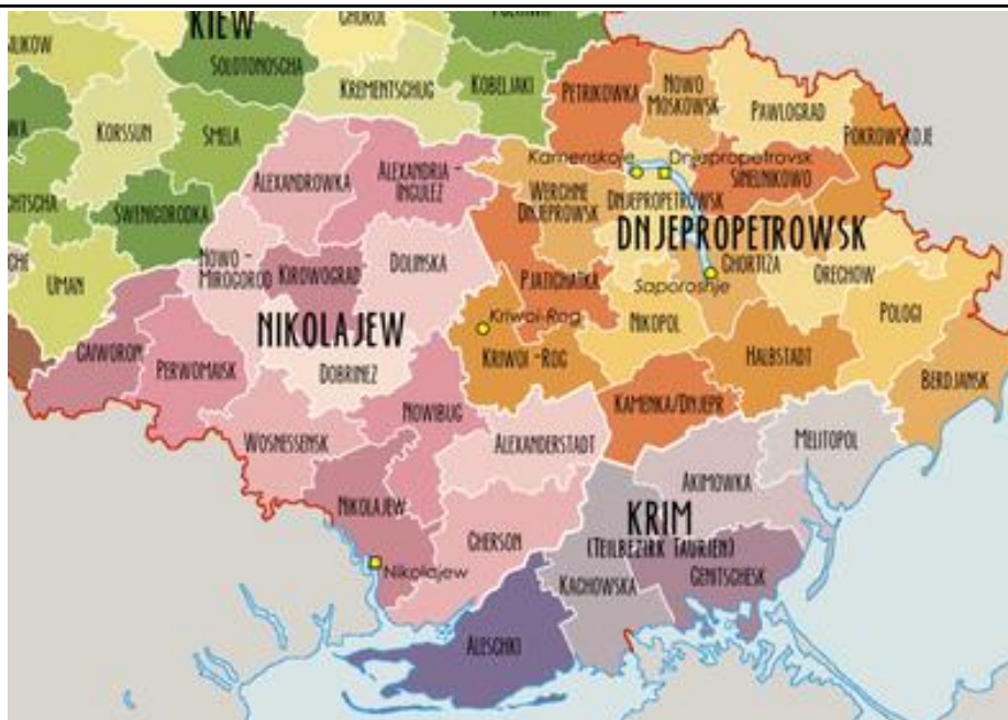
Карта "Адміністративно-територіальний поділ Півдня України під німецьким цивільним управлінням (вересень 1943 р.)" 1

Копіювання губерньського дореволюційного устрою німцями призвело до ліквідації радянського поділу Півдня України на Дніпропетровську, Миколаївську, Запорізьку області. При цьому німецька окупаційна адміністрація незмінним залишила довоєнний поділ на райони, адже "...це влаштовувало окупантів з адміністративної і господарської точки зору, а також тому що населення звикло до них" [4, с.94]. Загалом же "подальший адміністративний поділ не відповідав доокупаційному: з одного боку, з політичних міркувань, з іншого – внаслідок незбігу територій німецьких військових органів з територіями колишніх областей (польові комендатури контролювали по кілька колишніх районів, які після передачі управління цивільній адміністрації рейхскомісаріату становили основу крайзгебітів)" [11, с.60].