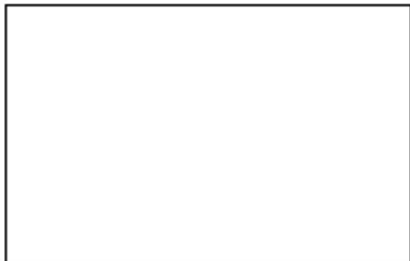
Рис. 1 – Назва малюнку