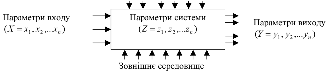
Рисунок 1 – Основні характеристики інформаційної системи

Інформаційна система характеризується параметрами входу та виходу які є взаємозалежними, між ними існує прямий причинно-наслідковий зв'язок, що виявляється у функціонуванні системи. Окрім вхідних і вихідних параметрів, система характеризується множиною змінних, які визначають внутрішній стан (рис.1).