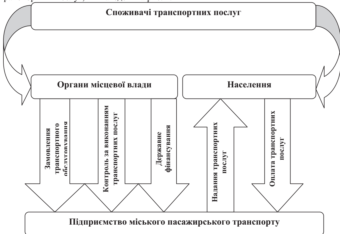
Рисунок 2 – Схема взаємовідносин підприємств міського пасажирського транспорту із споживачами транспортних послуг

Необхідно зазначити, що особливості діяльності підприємств міського пасажирського транспорту в певній мірі визначаються їх відносинами із споживачами транспортних послуг, які наведені на рис. 2.