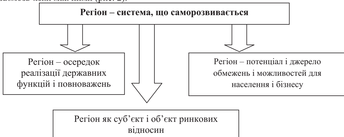
Рисунок 2 – Регіон як складна підсистема системи національної економіки

розглядати як соціально-економічну підсистему національної економіки, що включає, перш за все, взаємовідносини в системі «населення – бізнес – влада», а також сукупність різних елементів системи регіонального відтворення, що створюють його інфраструктуру. У ній можна виділити такі види – виробничу, фінансову, соціальну та ін., в рамках яких елементи регіональної відтворювальної системи знаходяться в безперервній взаємодії. Дія зовнішнього середовища на регіон, з одного боку, і складна система міжелементних взаємозв'язків, з іншого, обумовлюють постійний рух системи регіонального розвитку. Сам характер взаємозв'язків між елементами визначається межами того соціально-економічного простору, в яких відбувається їх розвиток, – ресурсами, виробничими можливостями, структурою виробництва і споживання, міжрегіональними зв'язками, впливом держави тощо. Отже, дія на процеси регіонального розвитку – це дія на розвиток відносин між його елементами, на взаємозв'язки між ними (рис. 2).