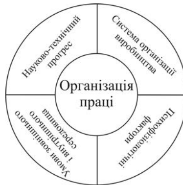
Рисунок 1 – Фактори, які впливають на організацію праці на машинобудівному підприємстві

Організація праці на машинобудівних підприємствах здійснюється в конкретних формах, різноманітність яких залежить від таких основних факторів, які зображені на рисунку 1.