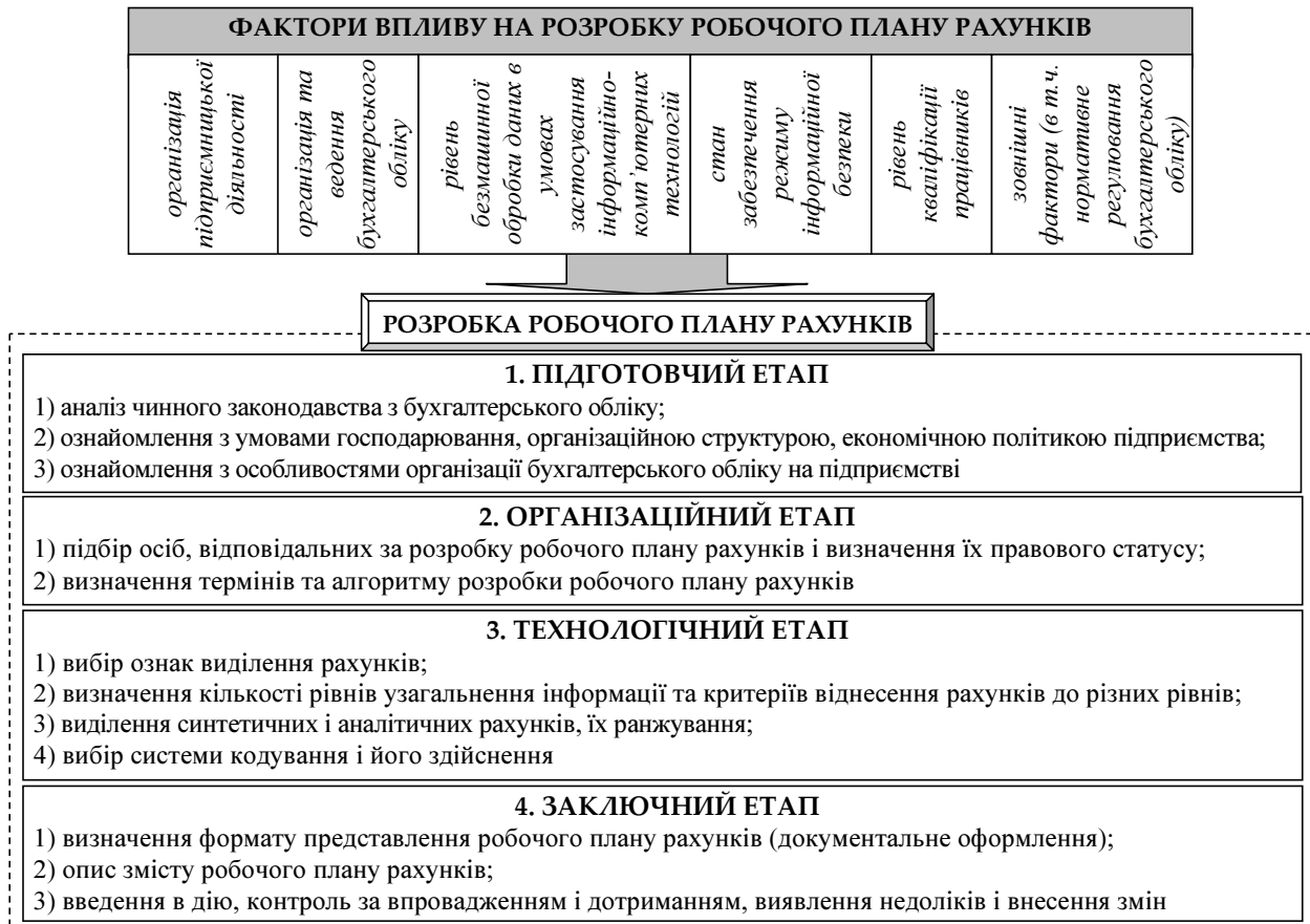
Рисунок 2 - Порядок розробки робочого плану рахунків на підприємстві

Перед побудовою робочого плану рахунків слід проаналізувати діючі норми чинного законодавства з бухгалтерського обліку, ознайомитися з умовами господарювання підприємства, його організаційною структурою, тактичними і стратегічними планами, фактичним станом бухгалтерського обліку та організації документування. Далі слід встановити перелік осіб, відповідальних за розробку робочого плану рахунків, терміни і алгоритм побудови.