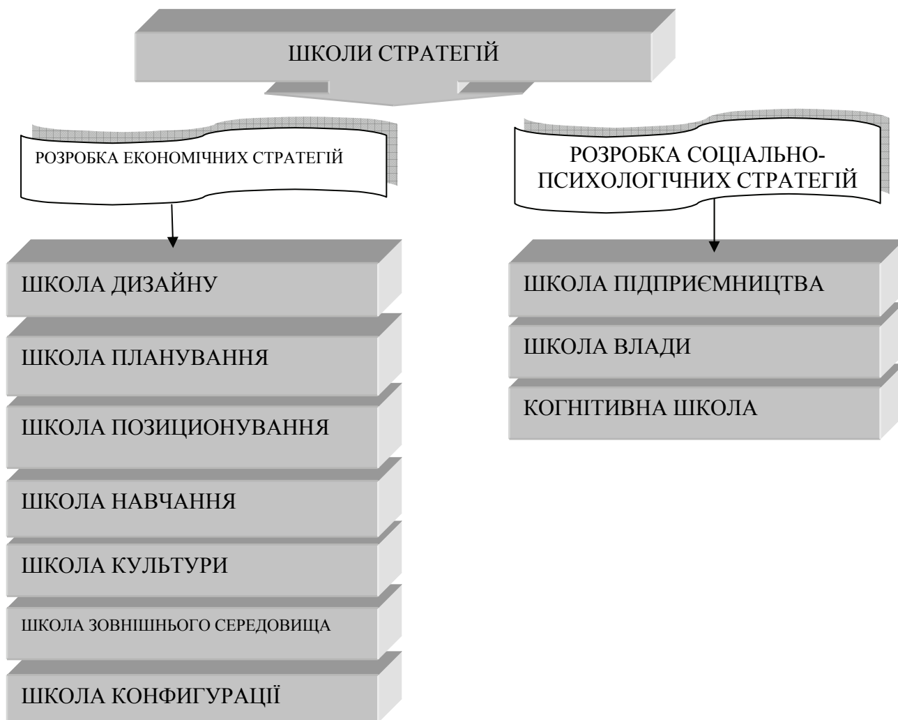
Рисунок 2 - Школи стратегій

Г. Мінцбергом в роботі «Школи стратегій» [7] детально охарактеризовано моделі та основні положення всіх зазначених шкіл.