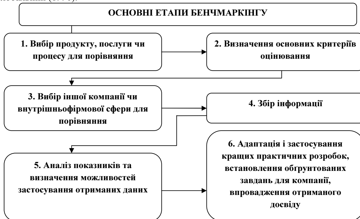
Рисунок 1 – Основні етапи бенчмаркінгу на підприємстві

За рівнем управління виокремлюють стратегічний, тактичний та оперативний види бенчмаркінгу. В еволюції розвитку теорії бенчмаркінгу можна виокремити такі три основні етапи: конкурентний (1972); диференційний (1982); стратегічний (1986); глобальний (1990).