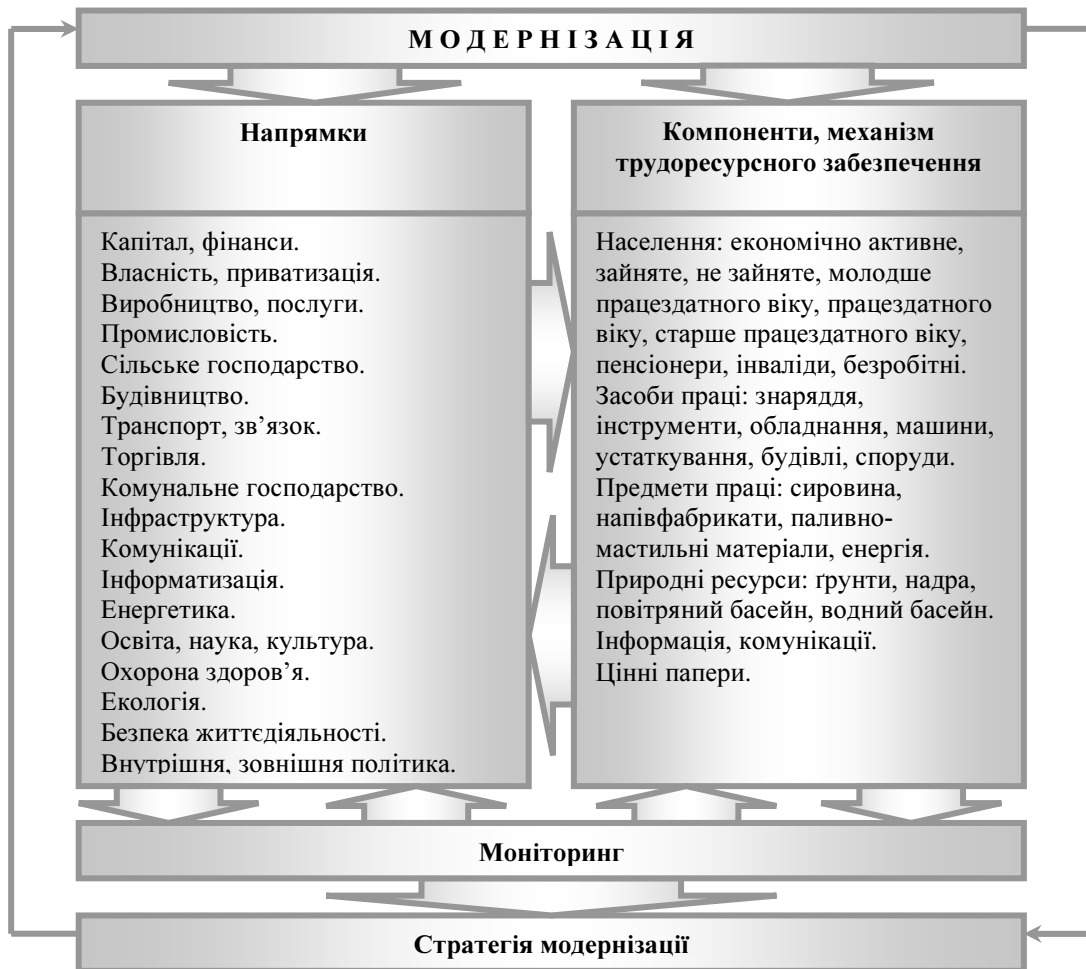
Примітка: Побудовано автором на основі узагальнення наявної інформації Рисунок 1 - Концептуальна схема модернізації трудоворесурсного забезпечення потреб економіки регіону

Концептуально уявляємо модернізацію як процес прогресивних змін, що діє за напрямками, комплексно впливаючи, як на окремі компоненти трудоворесурсного забезпечення економіки, так і на весь механізм такого забезпечення в цілому (Рис. 1).