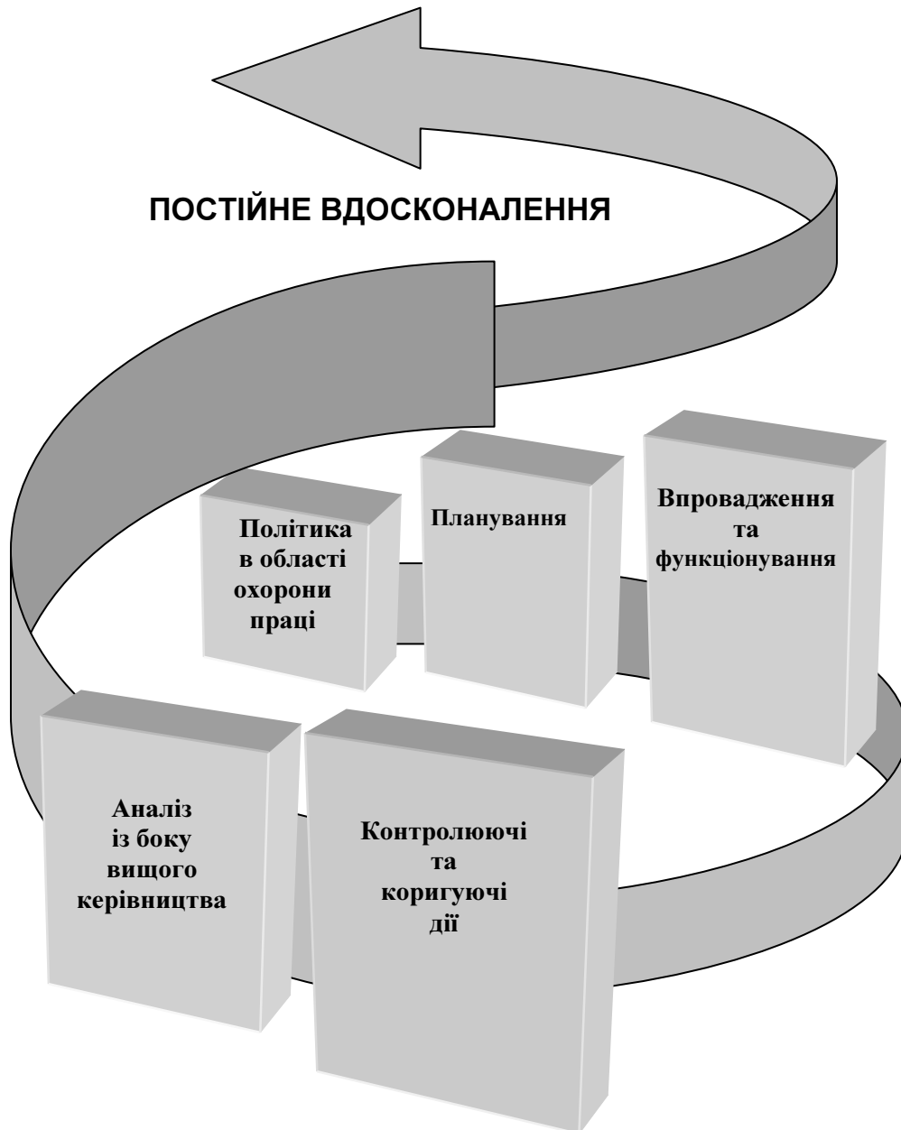
Рисунок 2 – Модель СУОП та її основні елементи (стандарт OHSAS)

Організація охорони праці в зоні НС передбачає виконання як організаторами (керівниками), так і виконавцями (рятувальниками) ряду загальних вимог, що забезпечують безпеку при проведенні АРІНР.