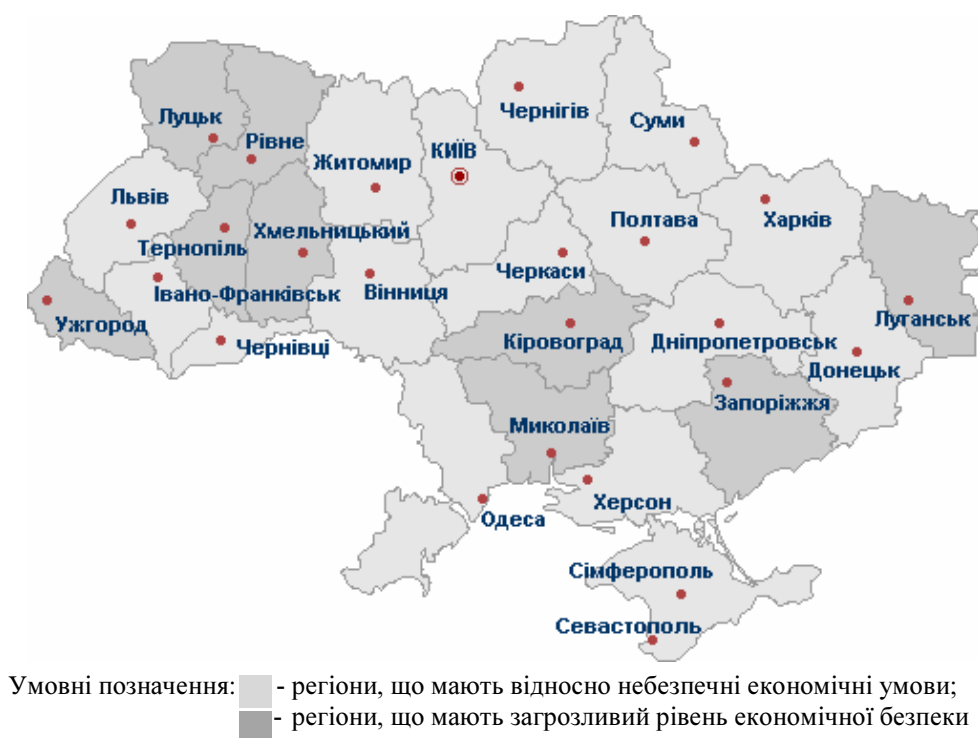
Рисунок 2 - Рівень економічної безпеки регіонів України на 2011 р.

Проведений аналіз показав, що в переважній більшості регіонів значення показників економічного розвитку та економічної безпеки мають значну диференціацію за регіонами та незначну позитивну динаміку на кінець 2011 року. Розглянемо економічну ситуацію за регіонами, розділивши їх за показником ВРП у розрахунку на одну особу на дві групи: I – регіони, що мають відносно небезпечні економічні умови; II - регіони, що мають загрозований рівень економічної безпеки (рис.2).