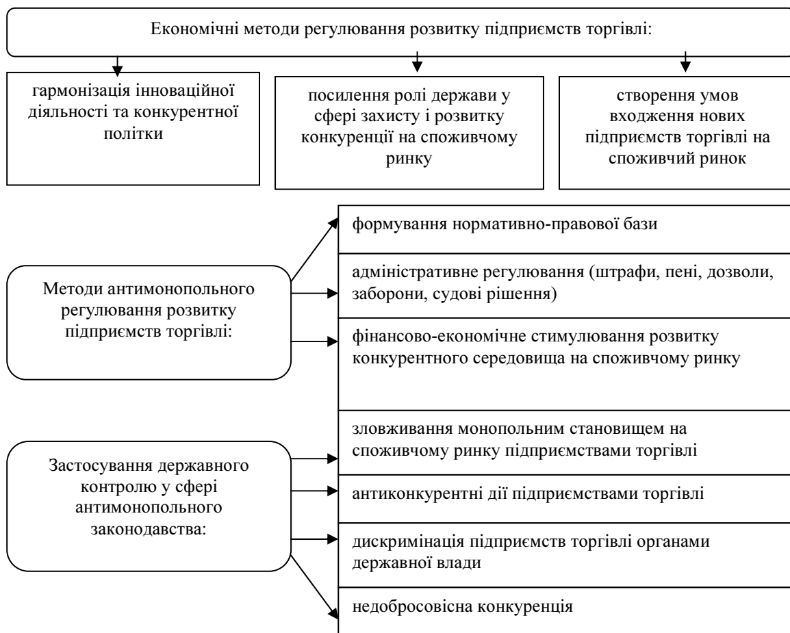
Рисунок 1 – Економічні методи та методи антимонопольного регулювання розвитку підприємств торгівлі в Україні

монопольного становища на споживчому ринку, недобросовісної конкуренції, змові торговельних підприємств щодо збуту продукції, встановлення відповідного рівня цін, обмеження продажу окремих видів товарів виробників тощо.