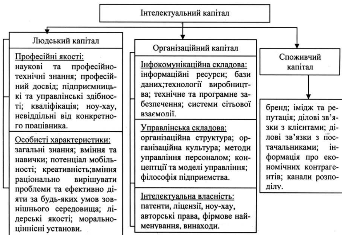
Рисунок 2 – Структура інтелектуального капіталу

Отже, на сьогодні існує багато підходів до структуризації інтелектуального капіталу, їх можна розділити на три групи. Перша група вчених дотримується думки, що інтелектуальний капітал складається з людського, організаційного та споживчого капіталів, друга група спрощує структуру, виділяючи лише людський та організаційний капітал, а представники третьої групи пропонують розширену структуру, виділяючи, окрім вище перерахованих складових, ще інтелектуальну власність, інфокомунікаційний та управлінський капітал, як самодостатні складові. Усі структурні складові взаємопов'язані, проте провідну роль в структурі інтелектуального капіталу відіграє людський капітал. На нашу думку, інтелектуальний капітал складається з людського капіталу, що включає професійні та особисті характеристики працівників, організаційного капіталу, до складу якого у свою чергу входять інфокомунікаційна, управлінська складові та інтелектуальна власність, а також споживчого капіталу.