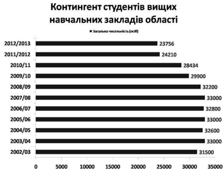
Рисунок 2 – Контингент студентів ВНЗ Кіровоградської області

кваліфікаційного рівня “молодший спеціаліст”. Це пояснюється мотивами батьків забезпечити дітей від ризику отримати негативні результати ЗНО, а відповідно втрати можливості подальшого навчання на першому курсі ВНЗ.