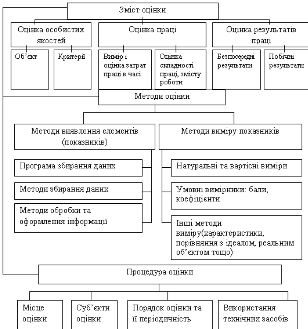
Рисунок 1 - Складові оцінки персоналу*

*Джерело: Складено автором з використанням [2]