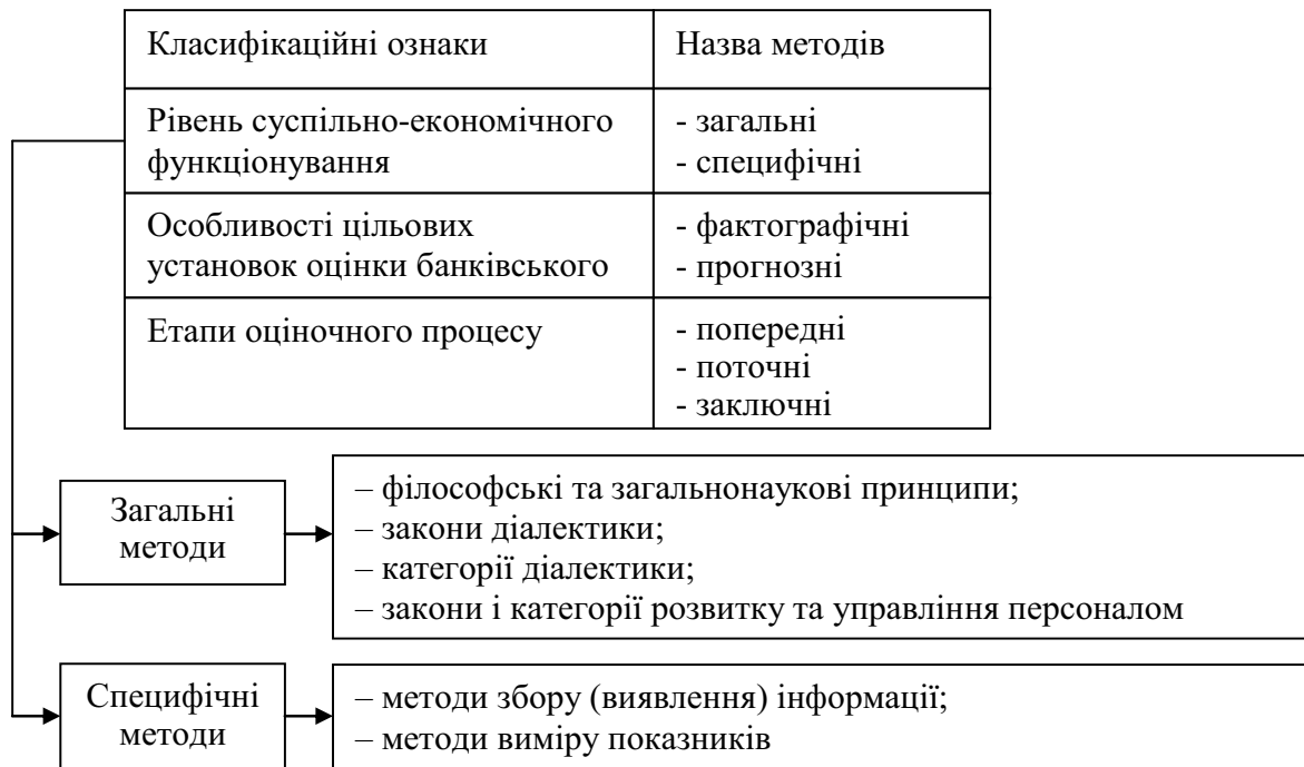
Рисунок 2 – Класифікація методів оцінки банківського персоналу

Згідно з вищевказаною класифікацією крім загальних методів існують і специфічні методи оцінки персоналу, які, у свою чергу, поділяються на методи збору (виявлення) інформації та методи виміру показників [1] (рис. 3).