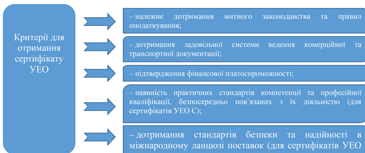
Рисунок 1 – Критерії для отримання сертифікату УЕО відповідно до ст. 39 МК ЄС та ст. 24-28 IP ЄС

– якщо заявник здійснює ЗЕД менше трьох років, то митний орган компетентний приймати рішення щодо оцінки даного критерію на підставі доступних записів та інформації про заявника.