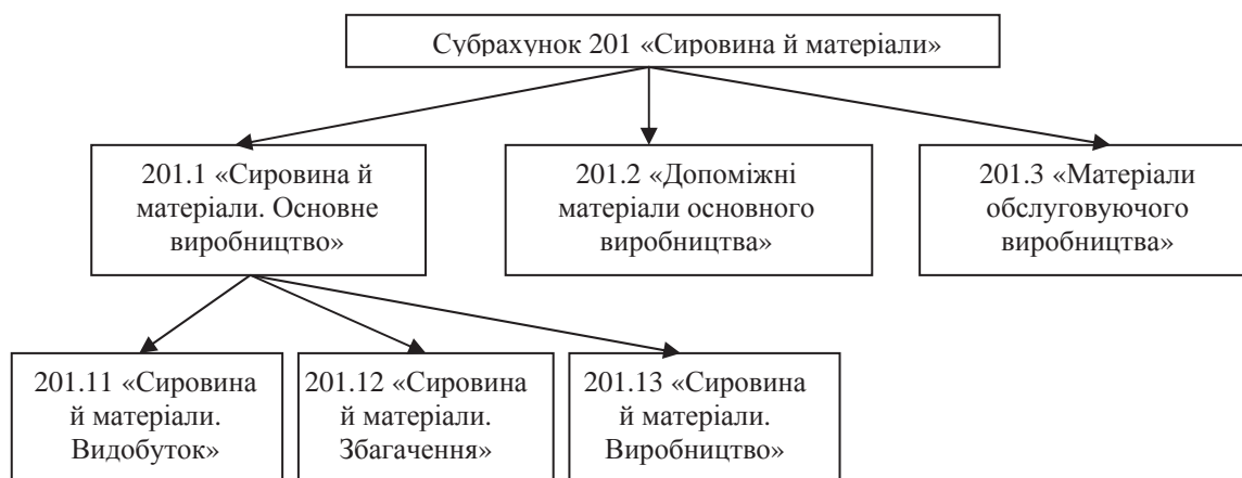
Рисунок 1 – Класифікація матеріалів й сировини за переділами технологічного процесу металургійних підприємств

На нашу думку, доцільним буде впровадження класифікації сировини, матеріалів і палива за ознакою належності до певного етапу виробничого процесу та для задоволення потреб аналітичного обліку виокремлення рахунків другого та третього порядків, що відображають вартість таких виробничих запасів на кожному етапі виробничого процесу.