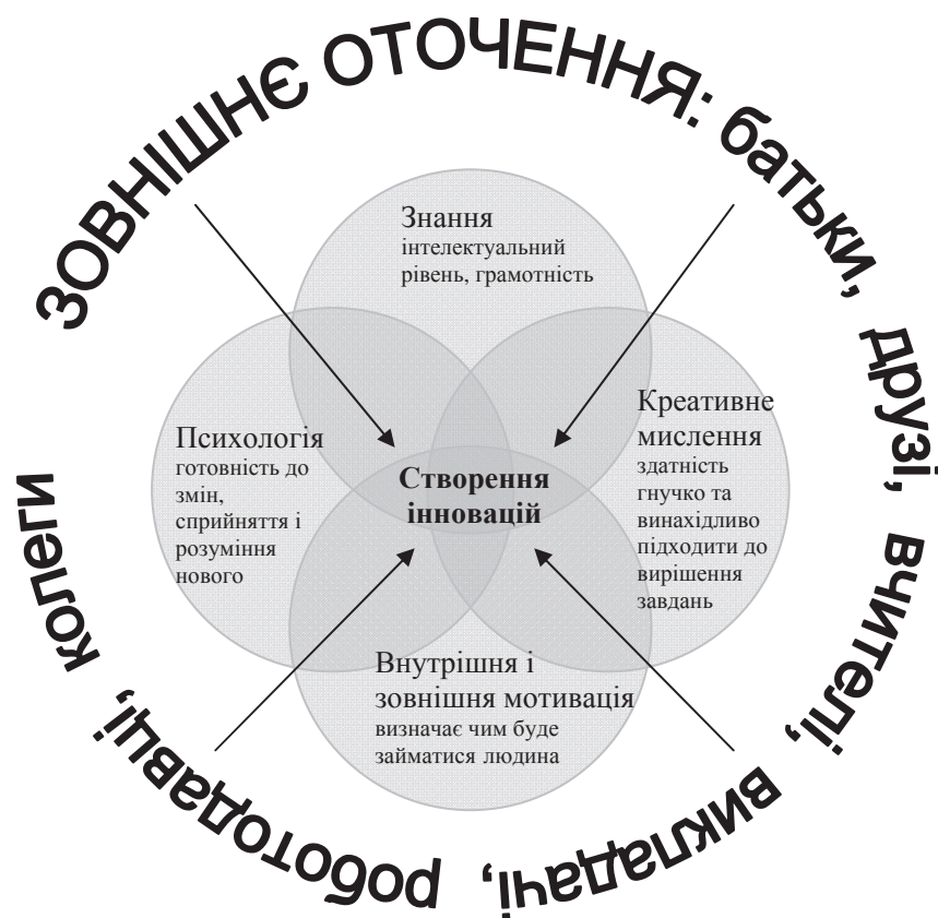
Рисунок 2 – Структура розвитку здатності молоді до створення інновацій

Існуюча практика мотивації креативної праці новаторів на українських підприємствах побудована переважно на загальних засадах мотивації персоналу. Основними підходами до мотивації такої праці на сьогодні залишаються фінансування та просування по кар'єрній сходиці. Досить розповсюдженим є також і застосування нематеріального стимулювання: робота за гнучким графіком, скорочення тривалості робочого часу за рахунок його економії в результаті високої продуктивності праці, публічне визнання праці співробітників, які отримали значні результати тощо.