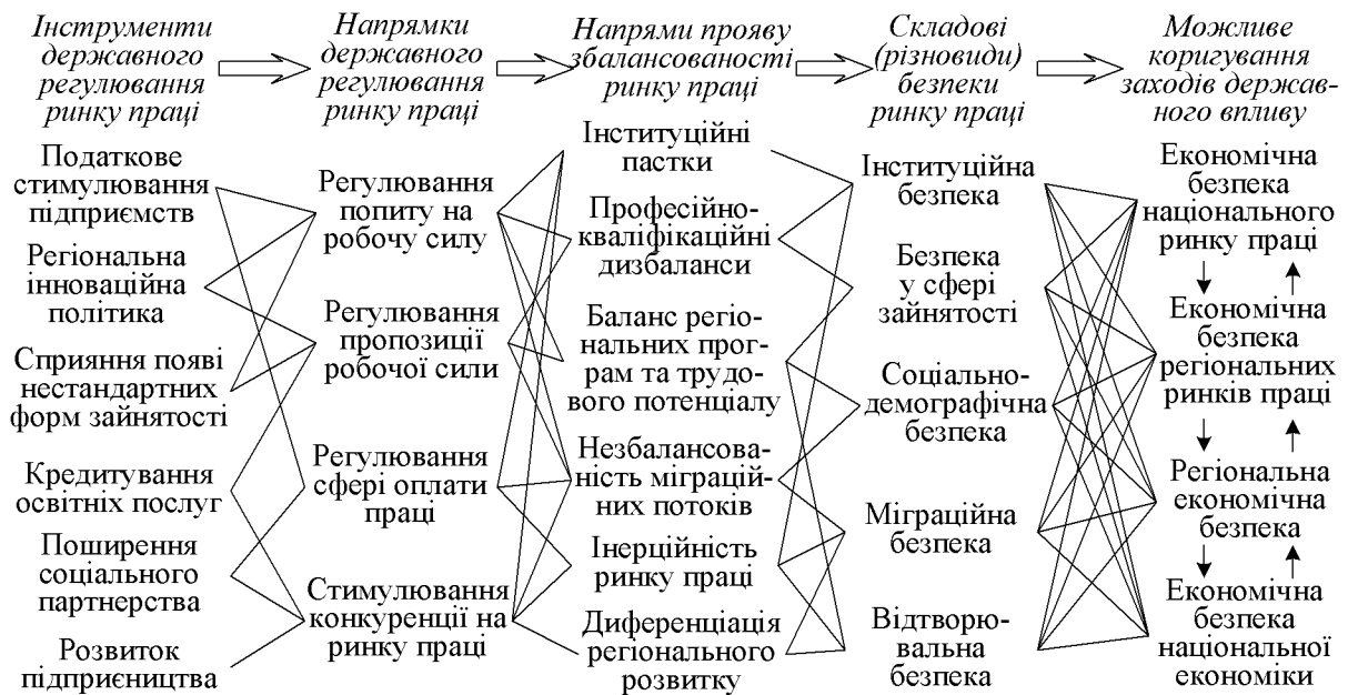
Рисунок 2 – Логіка організації державного регулювання ринку праці за критеріями забезпечення його збалансованості та достатності рівня економічної безпеки

державного регулювання економічної безпеки та збалансованості ринку праці. Графічне представлення такої логіки регулювання ринку праці наведено на рис. 2.