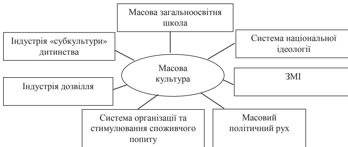
Рисунок 1 – Класифікація сфер прояву масової культури

Масова культура поступово стає специфічним продуктом сучасного індустріального урбанізованого суспільства, яка не знає традицій, не має національності, а її смаки та ідеали швидко змінюються у відповідності до потреб моди. Вона звертається до широкої аудиторії, апелює до спрощених вподобань, претендує на те, щоб бути народним мистецтвом [5]. Тобто стає середовищем, в якому безпосередньо відбувається формування людського капіталу та самим людським капіталом створюється новий продукт. Відповідно масова культура є своєрідним культурним індикатором країни на міжнародному рівні, прояв якої представлено у різних сферах (рис. 1).