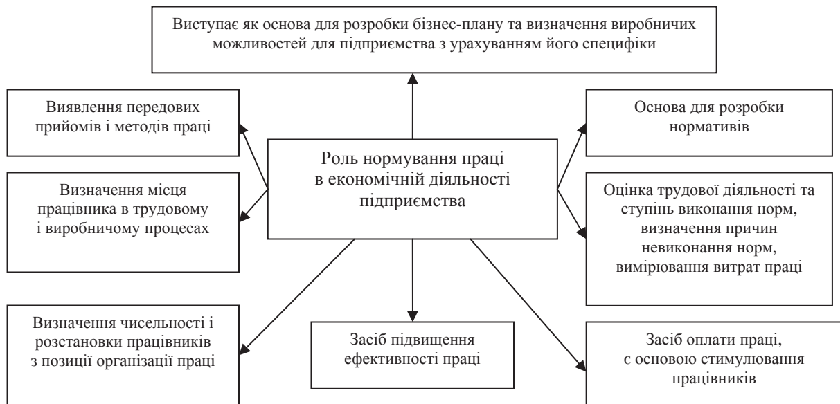
Рисунок 2 – Роль нормування праці в економічній діяльності підприємства