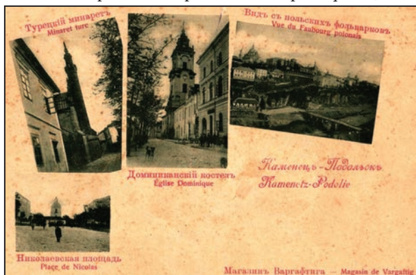
Рис. 8. Каменецъ-Подольскъ (Kamenetz-Podolie). Турецький мінаретъ (Minaret ture), Домініканський костелъ (Église Dominique), Видъ съ польскихъ фольварковъ (Vue du Faubourg polonais), Николаевская площадь (Place de Nicolas). Б.м : Магазинъ Варгафтига (Magasin de Vargaftig), [1899]

russe) 14 ; п'ята: Турецький мінарет, Домініканський костел, Вид з польських фільварок, Миколаївська площа (рис. 8) 15 ; шоста: Вид нового плану, Окружний суд, Троїцький монастир, Олександро-Невська церква (рис. 9) 16 .