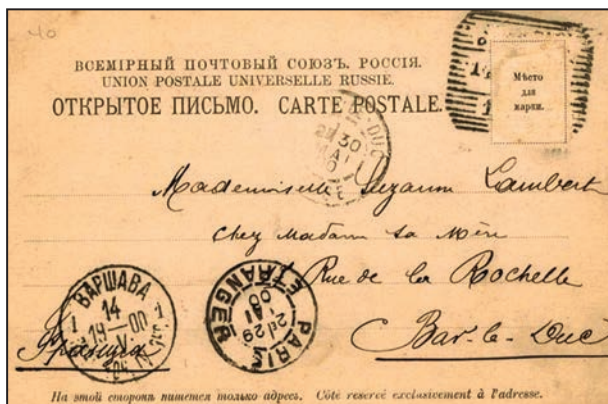
Рис. 6. Адресний бік другої поштівки серії