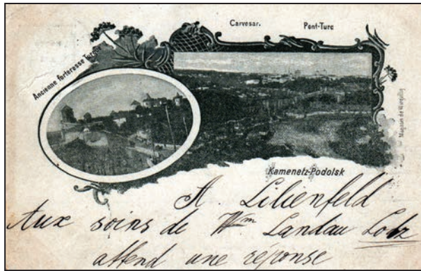
Рис. 1. Kamenetz-Podolsk. Ancienne forteresse Turque, Carvosar, Pont-Ture. Magasin de Wargaftig, [1894–1897]