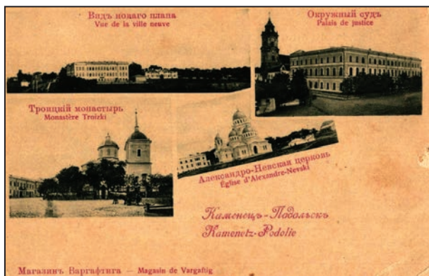
Рис. 9. Каменецъ-Подольскъ (Kamenetz-Podolie). Видъ новаго плана (Vue de la ville neuve), Окружний судъ (Palais de justice), Троїцький монастирь (Monastère Troizki), Александро-Невская церковь (Église d'Alexandre-Nevski). Б.м : Магазинъ Варгафтига (Magasin de Vargaftig), [1899]

Основою зворотного (фотографічного) боку листівок серії були чорно-білі фотографії видів м. Кам'янця-Подільського. Два види із 22, зображених на поштівках (Турецький мінарет та Кафедральна брама), відповідали світлинам з альбому М. Грейма 1901 р. 17 . Припускаємо, що автором 20 інших світ-