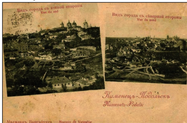
Рис. 5. Каменець-Подольськ (Kamenetz-Podolie). Видъ города съ южной стороны (Vue du sud), Видъ города съ северной стороны (Vue du nord). Б.м.: Магазинъ Варгафтига (Magasin de Vargaftig), [1899]

Друга поштівка з цієї серії відображала місто з південного та північно-го боків (рис. 5). Відповідно до маркування вона була відправлена з Варшави (14.V.1900) через Париж (2 el 29. AI. 00) у французький муніципалітет Бар-ле-Дюк (2 el 30. AI. 00) (рис. 6) 11 .