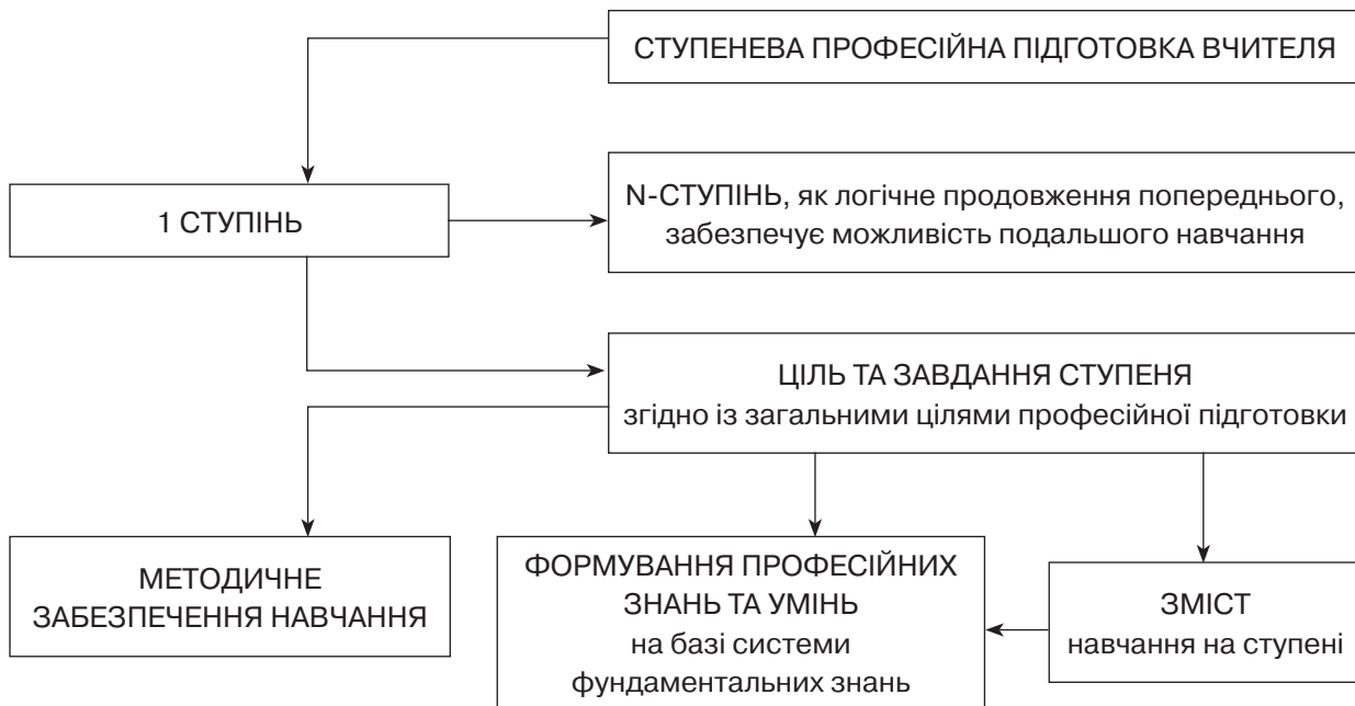
Рис. 2. Модель ступеневої підготовки вчителя