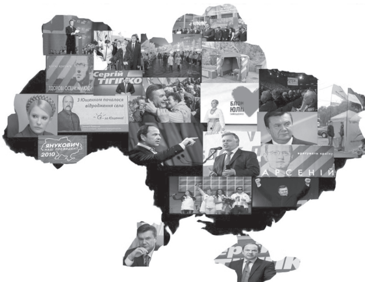
Рис. 2. Вибори 2010 р.

Вибори 2012 р. не дуже відрізняються від попередніх. Політичні партії завдяки створеним символічним образам, міфологемам формують певні ціннісні орієнтації у насе-