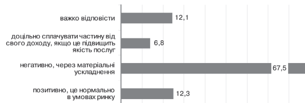
Рис. 3. Розподіл респондентів щодо ставлення до платних соціальних послуг, (%)

Враховуючи, що переважна більшість респондентів (86,7 %) мають низький та відносно задовільний рівні матеріального забезпечення, зрозумілим є те, що 67,5 % опитаних негативно ставляться до платних соціальних послуг саме через матеріальні ускладнення (рис. 3); 6,8 % готові сплачувати частину від свого доходу, якщо це підвищить якість послуг; 12,1 % важко відповісти на це запитання. Позитивно до платних соціальних послуг ставляться 12,3 %, вважаючи, що це нормально в умовах ринку.