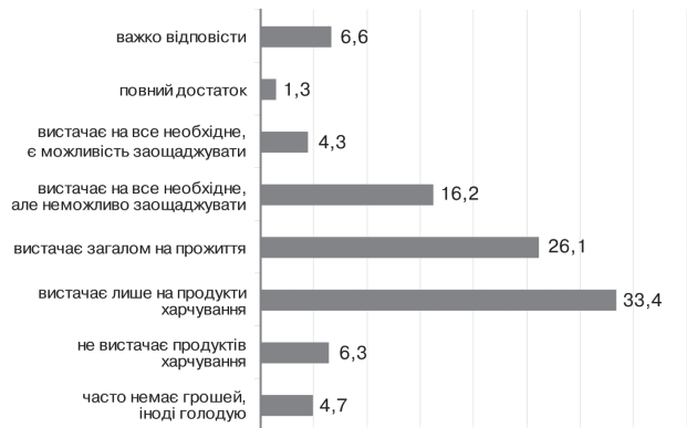
Рис. 2. Розподіл респондентів за матеріальним станом, (%)

Група відповідей, яку можна класифікувати як відносно задовільний рівень матеріального забезпечення (позиції “вистачає загалом на прожиття” (26,1 %) та “вистачає на все необхідне, але неможливо заощаджувати” (16,2 %), — в сумі дає 42,3 %.