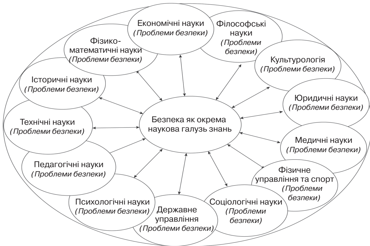
Рис. 1. Безпека як інтегральна галузь наукових знань

Розглядаючи національну безпеку як окрему наукову галузь (рис. 1.), ми маємо зро-