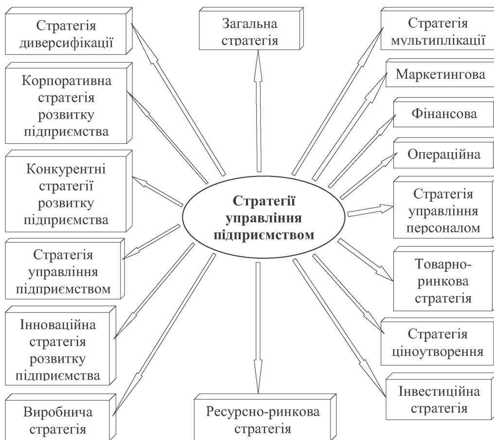
Рис. 2. Класифікація стратегій управління сучасним підприємством

Моделювання діяльності підприємств в умовах фінансової кризи передбачає побудову двох груп моделей — концептуальних аналогів маркетингової стратегії та моделей їх локальних елементів. Вони орієнтуються на правильне визначення маркетингової стратегії, погодженої з конкретними умовами відповідної галузі, потенціалом та капіталом, яким володіє конкретне підприємство. Така модель ґрунтується на ідеї створення й підтримання розвитку певного напрямку діяльності підприємства і виконується для вивчення теоретичних основ його розвитку та розв'язання практичних проблем економіки й стратегічного менеджменту. Найважливішим завданням стратегії, що розробляється та застосовується в діяльності підприємств, є