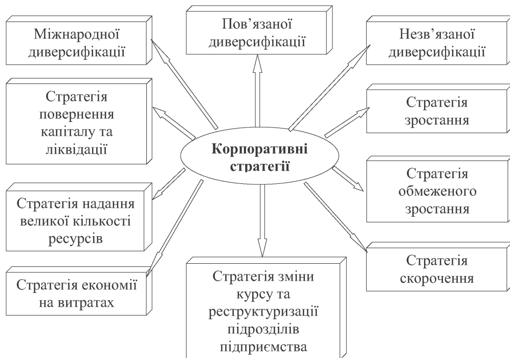
Рис. 1. Класифікація корпоративних стратегій розвитку підприємств

могою придбання організацій, створення їх з нуля, створення спільних організацій [3]. Цей вид диверсифікації характеризується наявністю синергетичних (взаємодіючих) ефектів (стратегічних співвідношень) – позитивного ефекту від взаємодії заставних частин організації, який перевищує суму ефекту від цих частин, що діють окремо. Стратегічні співвідношення бувають маркетингові, виробничі, керуючі.