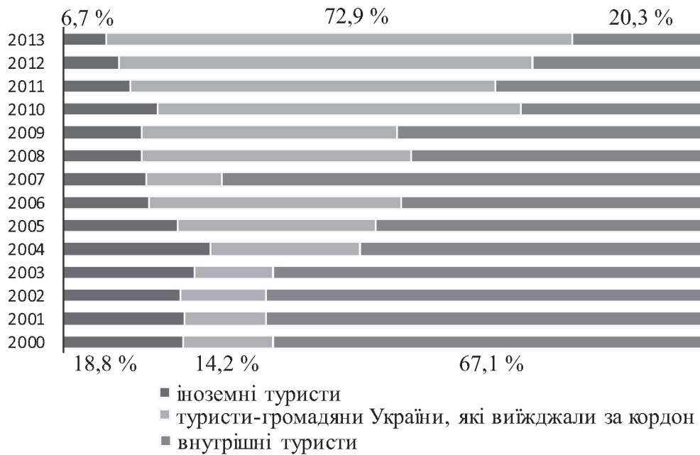
Рис. 1. Структура туристичного потоку в Україні у 2000–2013 рр. 1 .