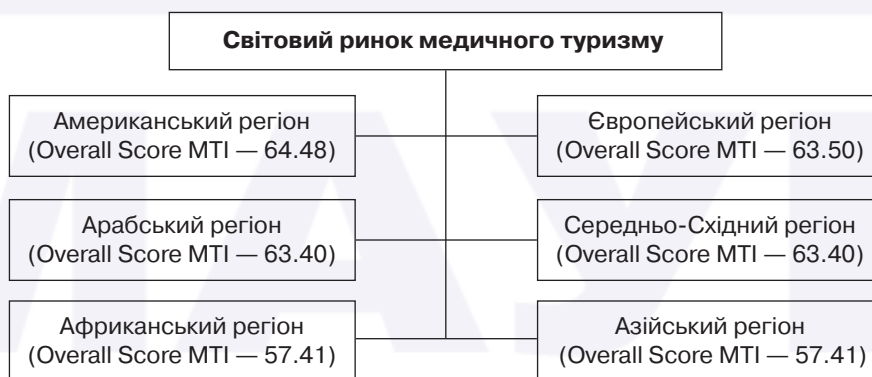
Рис. 2. Класифікація мегадестинацій медичного туризму (розроблено за даними Medical Tourism Index 2016 р.)