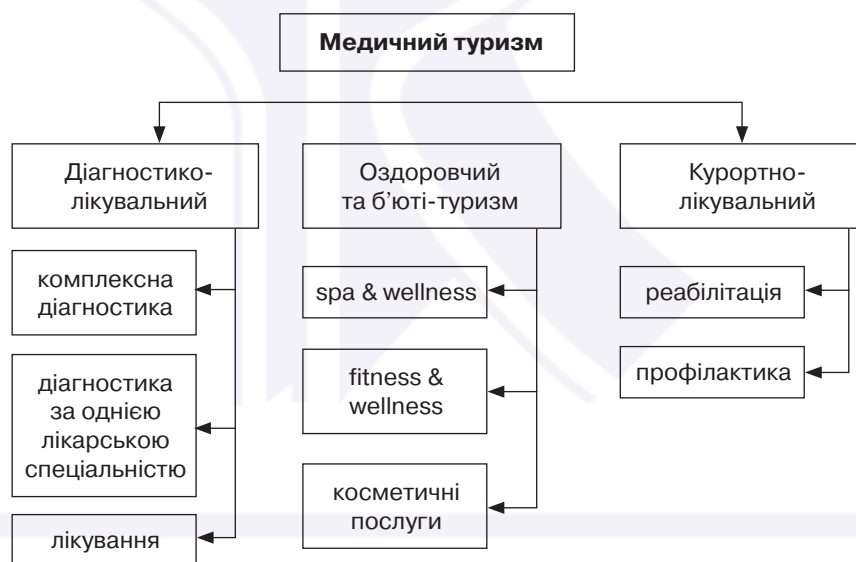
Рис. 4. Класифікація медичного туризму за видами (авторська розробка)

Діагностико-лікувальний туризм – подорожі в акредитовані заклади охорони здоров'я або до конкретних лікарів з метою