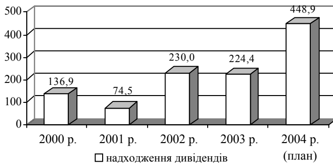
Рис. 3. Надходження до бюджету дивідендів, нарахованих на акції господарських товариств, які є у державній власності за 2000–2004 р. 15

У I кварталі 2004 р. до державного бюджету перераховано дивідендів на акції (частки, паї) господарських товариств, які є у державній власності, в сумі 153,902 млн грн 16 .