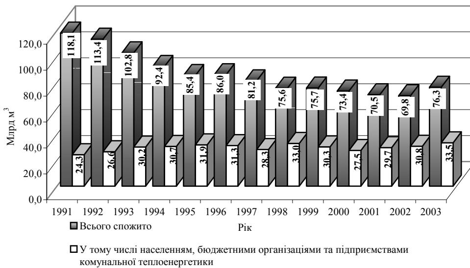
Рис. 1. Споживання природного газу в Україні у 1991–2003 рр.