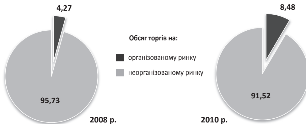
Рис. 2. Частка організованого ринку в загальному обсязі торгів

Складено за: Статистичний щорічник України за 2007 рік / Держкомстат України. – К., 2008. – 572 с.; Статистичний щорічник України за 2008 рік / Держкомстат України. – К., 2009. – 568 с.; Статистичний щорічник України за 2009 рік / Держкомстат України. – К., 2010. – 567 с.