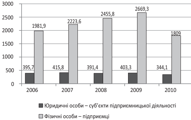
Рис. 1. Динаміка кількості суб'єктів підприємницької діяльності в Україні, тис. осіб

Трансформація податкової системи вплинула не лише на обсяги податкових надходжень, а й на кількість платників податків, особливо суб'єктів підприємницької діяльності, яка у 2010 р. скоротилася (рис. 1 і 2).