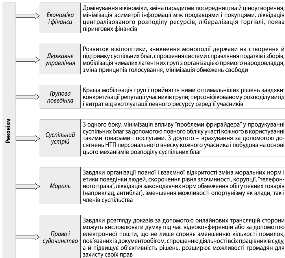
Рис. 1. Вплив реконізму на життя суспільства

фактично і будувалися централізовані системи управління. Це давало змогу не лише завищувати ціну благ для індивідів, позбавлених права на інформацію, а й формувати у них відчуття залежності від тих, хто мав до неї доступ. Однак принципи прозорості й доступності, що іманентно властиві Інтернет-мережі, допомагають залучати до спільної активності групи людей, які розділені кілометрами, кордонами, мовною і релігійною належністю, заради надання допомоги, розв'язання проблемних питань “по-горизонталі”. Д. Рашков із цього приводу зазначив, що “відкрите суспільство сприяє не краху парламентського процесу, а відродженню його у новій формі” 5 . Таким чином, вплив реконізму на життя суспільства є надзвичайним і проявляється у різних сферах (рис. 1):