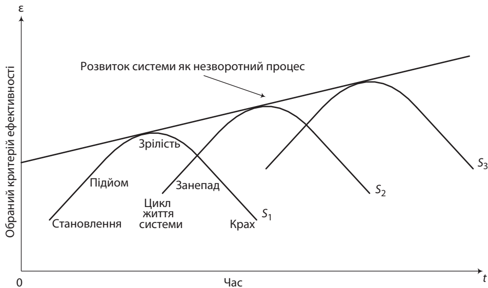
Рис. 1. Візуалізація розвитку економічних систем

Економічні системи також підпорядковані циклічному руху, що означає безумовну періодично повторювану послідовність і об’єктивну неминучість поетапного розвитку – від становлення до краху (рис. 1). У прогресивній фазі розвитку система зростає, поширюється й перетворюється на організоване ціле, в якому оптимально поєднуються її елементи, процеси організації та дезорганізації, котрі врівноважують один одного, а також спостерігається посилення ділової активності. Коли резерв поступальної модифікації вичерпується, лінійний розвиток припиняється, система проходить через критичну точку “А” (межа прогресивного розвитку) і входить у стан кризи. Обме-