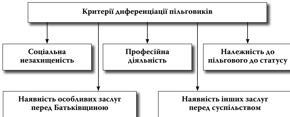
Рис. 2. Критерії диференціації осіб, які належать до пільгових категорій населення