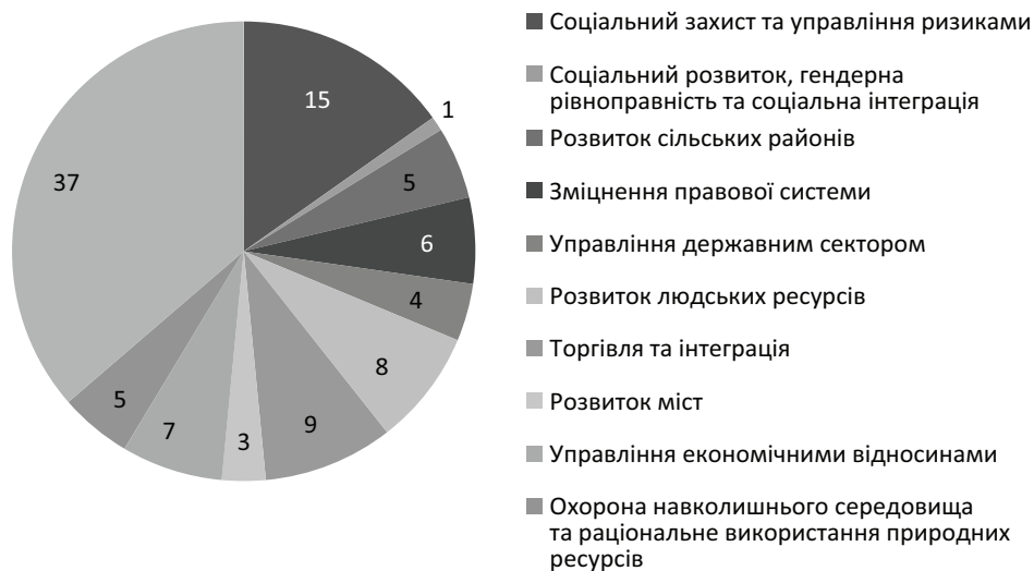
Рис. 3. Наданий кредит МБРР та МАР країнам Європи та Центральної Азії за напрямками у 2015 р., %