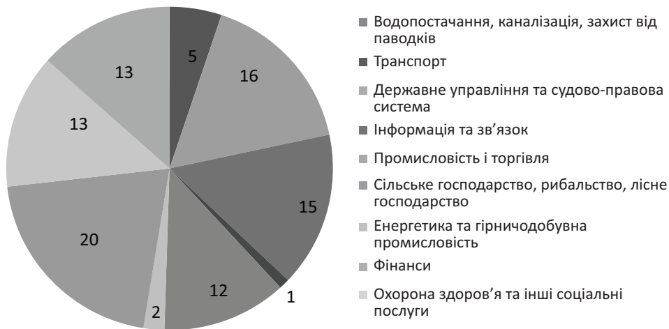
Рис. 2. Наданий кредит МБРР і МАР країнам Європи та Центральної Азії за секторами у 2015 р., %

транспорт (1,1 млрд) і державне управління та судово-правова система (1,1 млрд дол. США) тощо.