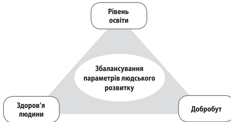
Рис. 2. Тріада збалансованого людського розвитку (системний підхід)