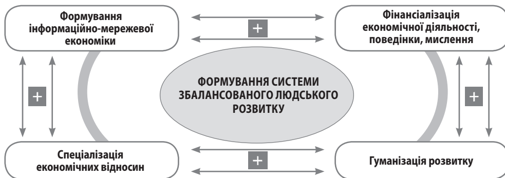
Рис. 5. Імперативи збалансованого людського розвитку

Складено за: Трансформація нашого світу: Порядок денний стійкого розвитку 2030: Програма ООН. URL: http://www.un.org.ua/ua/tsili-rozvytku-tysiacholittia/tsili-staloho-rozvytku ; Information Economy Report 2017. Digitalization, trade and development / UNCTAD. Switzerland, 2017. 129 p.; Гернего Ю. О. Людиноцентрична концепція розвитку збалансованого суспільства. Модернізація економіки в умовах зростання суспільної свідомості: туризм, людиномірність, партнерство, кооперація: матеріали II Всеукр. наук.-практ. інтернет-конф. (м. Полтава, 14 грудня 2017 р.) . Полтава: ПУЕТ, 2017. С. 107–110; G 20 Leaders Communique Hangzhou Summit (4–5 September 2016). URL: http://europa.eu/rapid/press-release_STATEMENT-16-2967_en.htm .