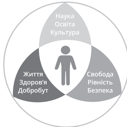
Рис. 4. Людиноцентрична модель збалансованого розвитку