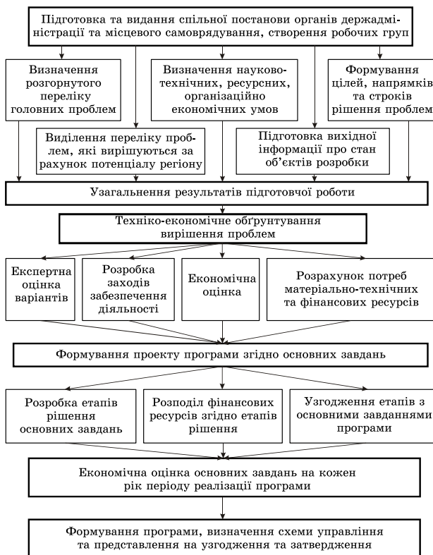
Рис. 2. Схема розробки територіально-галузових програм розвитку малого виробничого підприємництва у харчовій промисловості України

На рис. 2 подано авторську схему розробки територіально-галузових програм сприяння розвитку малого виробничого підприємництва.