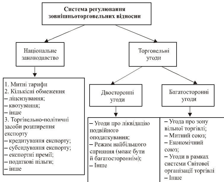
Рис. 1. Система регулювання зовнішньоторговельних відносин [4, с. 50—55]

Вони, в свою чергу, включають низку засобів державного регулювання, які прямо чи опосередковано впливають на експортну діяльність підприємств (див. Рис. 1). Розглянемо кожний з засобів державного регулювання з точки зору впливу на здійснення експортної діяльності підприємствами олійно-жирової галузі.