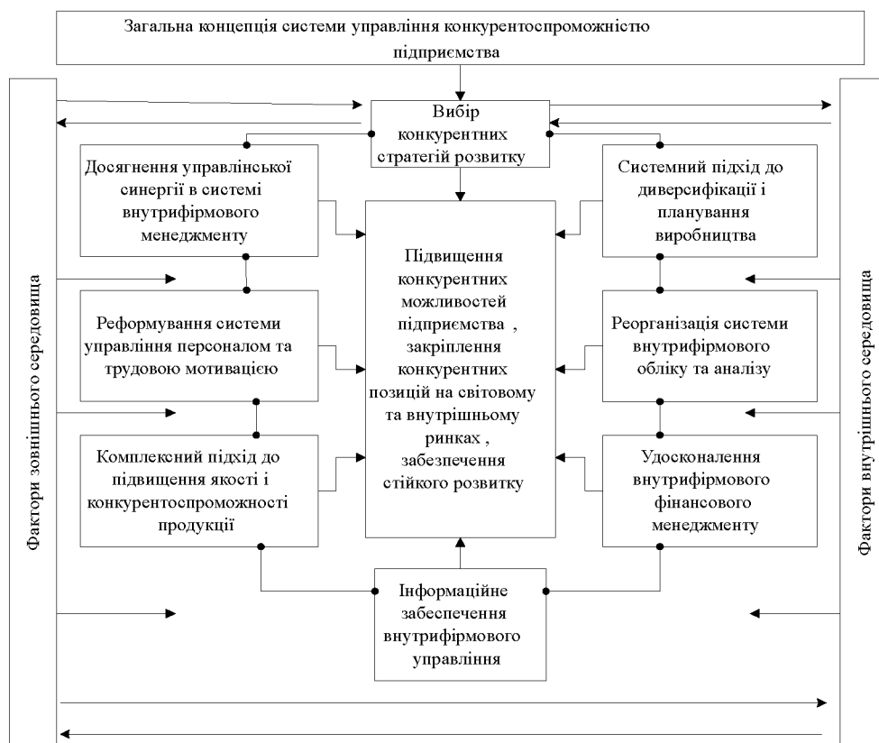
Рис. 3. Модель управління конкурентоспроможністю підприємства [2]

Як свідчить Г.М. Скударь в своїй монографії, ця система повинна складатися «з комплексу взаємопов'язаних блоків (елементів системи), на які впливають зовнішні та внутрішні фактори, але утворюють певну цілісність. Така модель відноситься до типу цілеспрямованих систем, тобто тих, що прагнуть в процесі свого функціонування до досягнення конкретних цілей» [2]. Це ствердження Г.М. Скударь підтверджує розробленою моделлю управління конкурентоспроможністю сучасного підприємства (рис. 3) [2].