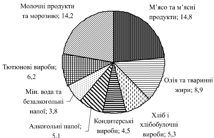
Рис. 1. Питома вага підприємств молокопереробних

Реформи в аграрному секторі України просуваються повільно і неефективно. Одна з причин — неспроможність Уряду виробити і втілити дієву стратегію реформ, спрямовану на забезпечення тривалої ефективності молочної галузі та підвищення її конкурентоспроможності [2]. Зазначені обставини призвели до скорочення у великих масштабах поголів'я молочного стада у господарств усіх категорій (табл. 1).