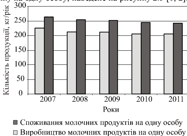
Рис. 3. Баланс виробництва та споживання молока та молочних продуктів

Ми бачимо, що виробництво молочних продуктів перевищує споживання протягом усього проаналізованого періоду. Тобто, пропозиція молока та молочної продукції перевищує попит на неї, незважаючи на зменшення поголів'я корів, зменшення виробництва та збільшення якості продукції. На нашу думку, це пов'язано з низькою платоспроможністю населення, що змушує їх купувати споживчі товари з нижчою ціною політикою.