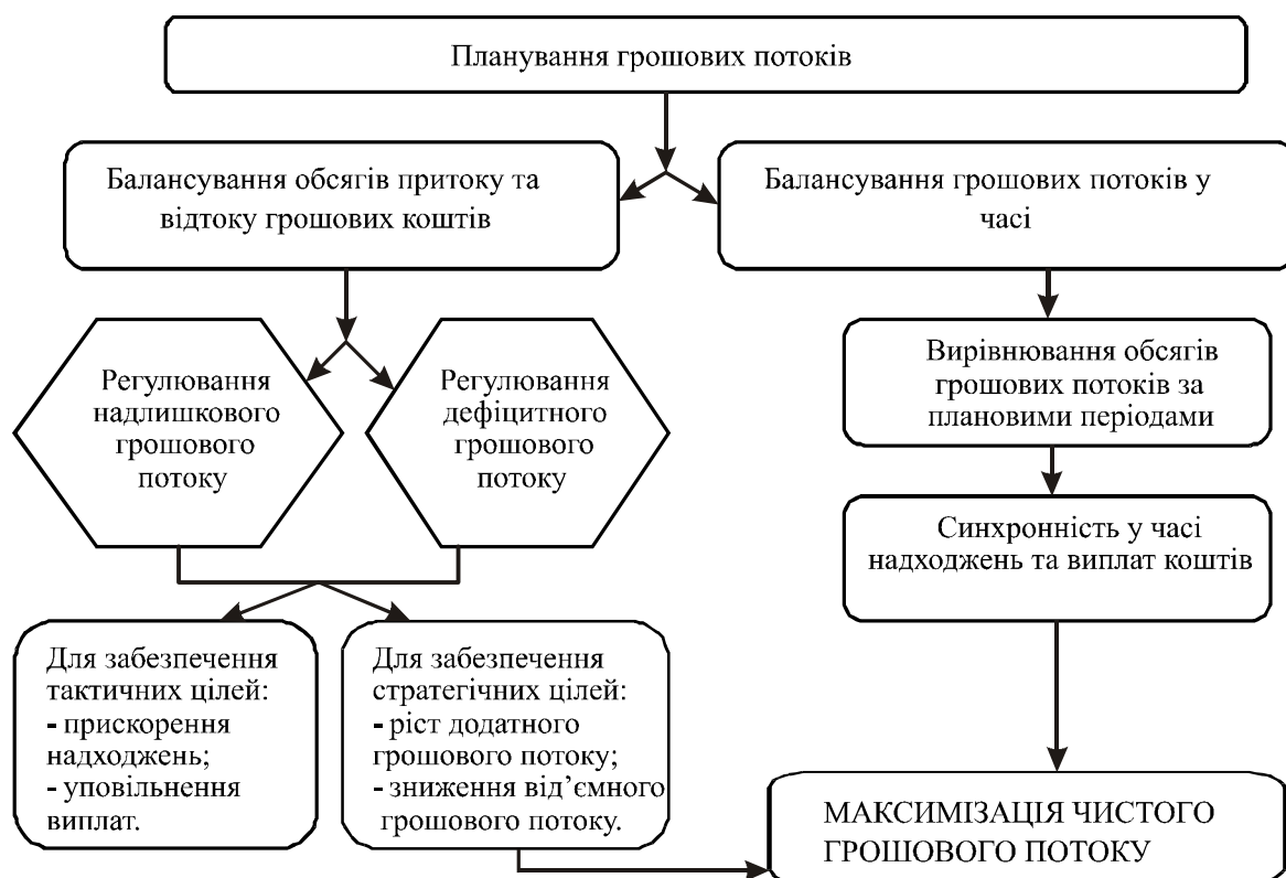
Рис. 2. Ефективність планування в контексті цілісної системи управління грошовими потоками підприємств

Тому ефективність роботи підприємства в значній мірі залежить від організації планування та управління грошовими потоками (Рис. 2).