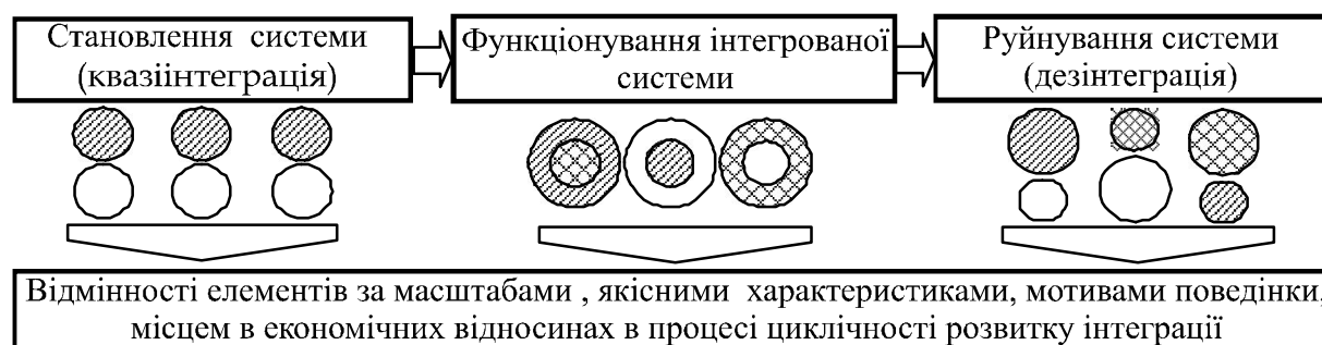
Рис. 2. Трансформація елементів системи в процесі розвитку інтеграції

Саме тому, на наш погляд, можна лише з певною ймовірністю визначити метаморфози складових елементів інтегрованої структури та взаємодію частин й цілого (рис. 2).