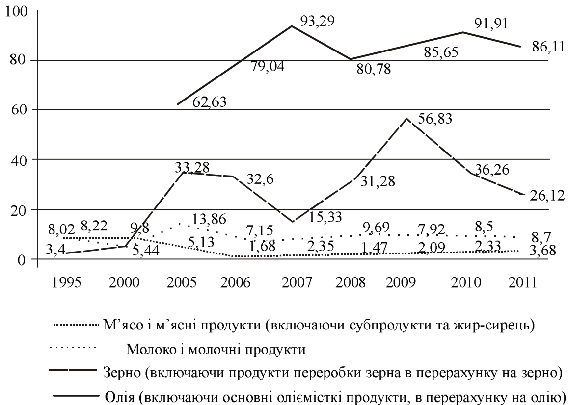
Рис. 1. Експортна орієнтація виробництва основних видів продукції сільського господарства в Україні [7]

Зростання світових цін на імпортовані харчові продукти і сільськогосподарську сировину спричиняє зниження життєвого рівня населення. Крім того, відбувається і непрямий вплив у випадку, коли за кордоном закуповується продукція, що проходить подальшу обробку й переробку в Україні, як, наприклад, какао-боби, різні прянощі, горіхи, рис, риба тощо.