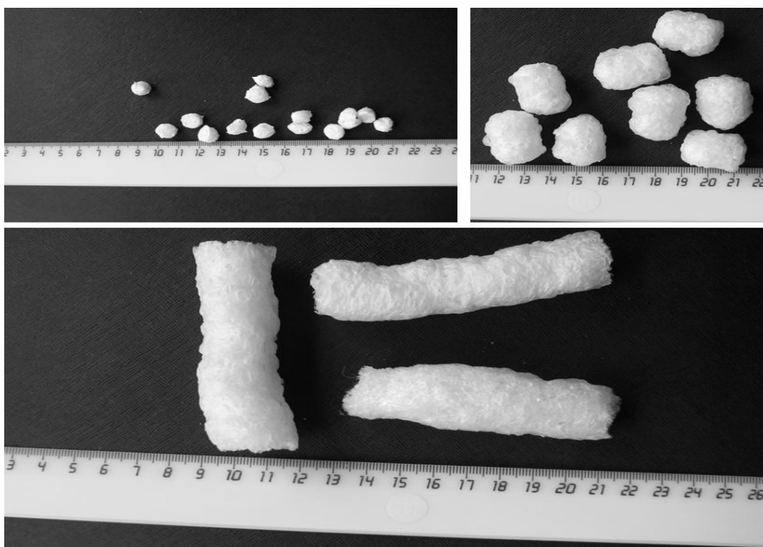
Рис. 2. Экструзионная (недробленняя) обогащающая добавка

Экструдированные продукты из крахмалосодержащего сырья могут быть представлены различной формой и размерами: от мелких частичек произвольной формы до включений в виде определенных геометрических фигурок с размерами от 0,3 см до нескольких сантиметров. Цвет таких продуктов может быть различным в зависимости от цвета входящих в их состав компонентов. В составе могут присутствовать витаминно-минеральные комплексы, пищевые волокна, полиненасыщенные жирные кислоты, пребиотики и другие функциональные добавки. Экструдированные продукты отличаются достаточно высокими показателями микробиологической безопасности ввиду того, что подготовленная для экструдирования смесь проходит при экструдировании обработку при высоких температурах и давлении.