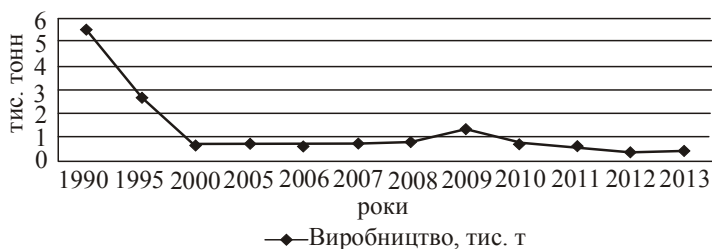
Рис. 1. Виробництво хмелю протягом 1990—2013 років

У 1990 р. в Україні загальна площа насаджень хмелю становила понад 7500 га, а валовий збір — 5555 тонн (рис. 1, 2).